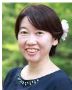
小野税務会計事務所 所長 税理士