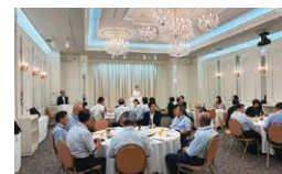
9月1日 組織・厚生合同会議