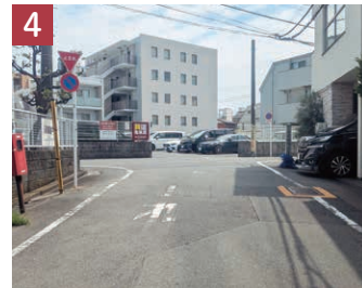
そこから少し上るとすぐに坂上に到着。トータル2～3分の坂探訪でした。