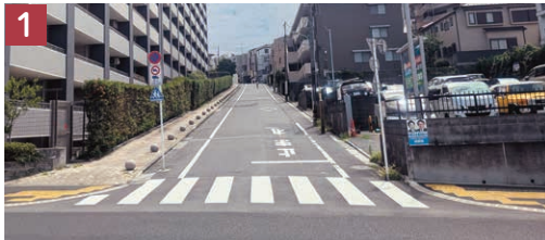
1 大久保坂の入り口。現在のマンションがある場所には、かつてゴルフの練習場もありました。

大きなマンションを含むこのあたりは、かつて自然林が広がる雑木林でした。住宅街として開発されたのは昭和の終わりころで、それまでは自然豊かな林が広がる子供たちの遊び場になっていたようです。昔の航空写真で当時の様子を見ることができます。