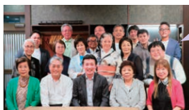
第四回例会にて記念写真

「絶品」をキーワードに、身近なお店から高級店まで、楽しく一緒にお食事をしませんか？