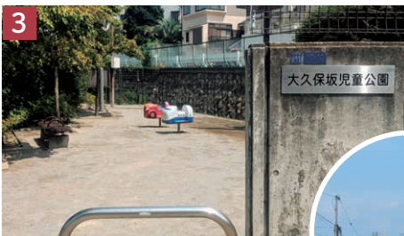
3 大久保坂児童公園を左手に通り過ぎる。このあたりで振り返ると遠くまでよく見渡せた。