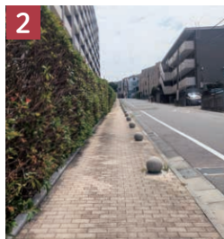
2 歩道は整備されており歩きやすい。傾斜はゆるやか。