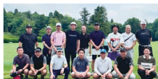
6月4日 青年部会OB交流ゴルフコンペ