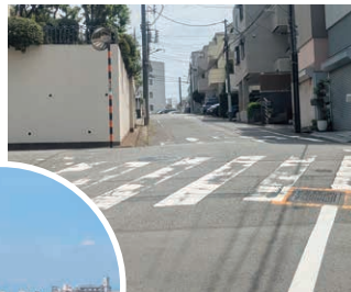
公園のあたりから少し左にカーブしている。