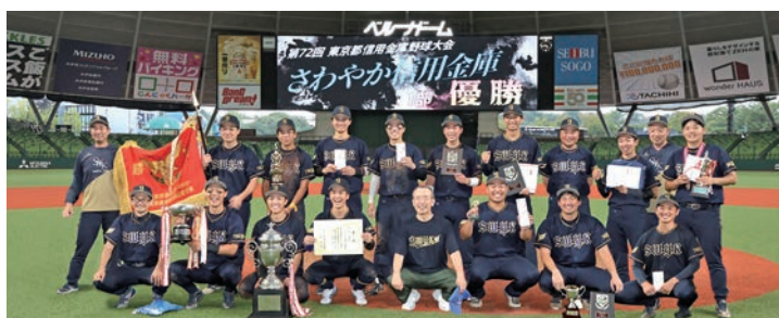
▲2023年9月30日 第72回東京都信用金庫野球大会 優勝

今後も地域と連携し、行政とも力を合わせ、大森法人会の皆様方とともに、地域の持続的発展と明るい未来の創造に努めていきたいと思っています。