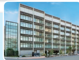
スマイル大森外観

大森北四丁目複合施設(愛称:スマイル大森)は、多彩な施設が集まった地域拠点で、令和6年12月1日にオープンしました。「スマイル大森」という愛称は入新井第一小学校の4年生から6年生たちが考えた244の候補から選ばれました。複合施設を利用する大森地域の方をはじめとした大田区のみなさんがスマイルになれるようにとの思いが込められています。