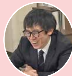
講師▶ 大森税務署第一部門 長岡上席