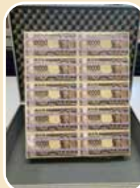
新1万円札 “渋沢栄一” 初登場!