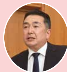
講師▶ 大森税務署 法人課税第一部門 関調査官