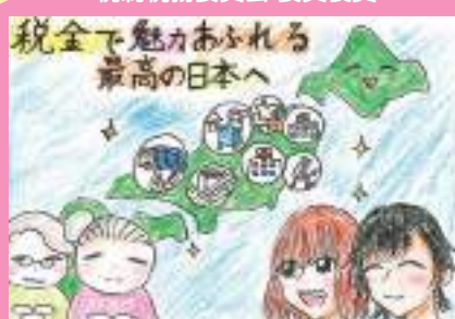
徳持小学校 新津 乙音