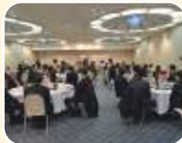
異業種交流会 大野支部長挨拶