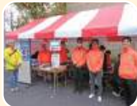
五日市支部 佐伯区民まつり