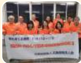
五日市駅 税を考える週間