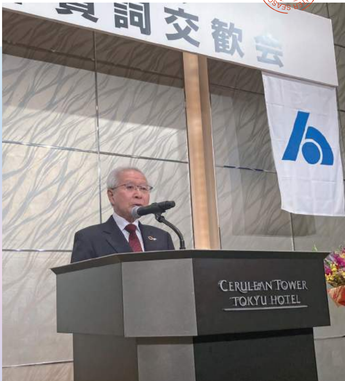
2024年新年賀詞交歓会