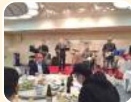
異業種交流会 バンド演奏

令和5年における五日市支部の活動は、11月5日(日)に4年ぶりとなる湯来フェスでの税金クイズ、及び同じく11月12日(日)の佐伯区民まつりにて税金クイズを行いました。意外に知らない税金についてのクイズに、子どもも大人も大いに楽しみました。また11月15日(水)には「税を知る週間」にあたり税のPRをJR五日市駅前で行いました。さらに12月1日(金)には異業種交流会を開催し、会員によるバンド演奏などもあり、参加者一同大いに交流を深めることができました。また小学校への租税教室の講師活動は、五日市が小学校の多い地区でもあり、各会員企業の方々により活発に行っております。租税教室を行った小学校から感謝の声をお聞きできることは、大変うれしく思います。