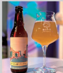
ジャーマン通りヴァイツェン