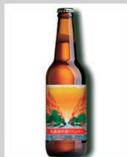
大森海岸通りアンバー (日立Ver)