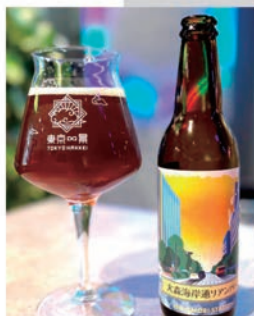
大森海岸通りアンバー

大森にある「通り」をビールで表現！ このまちの歴史や魅力、未来をまちの声を詰め込みました。