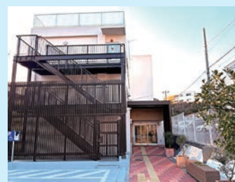
馬込アートギャラリー外観