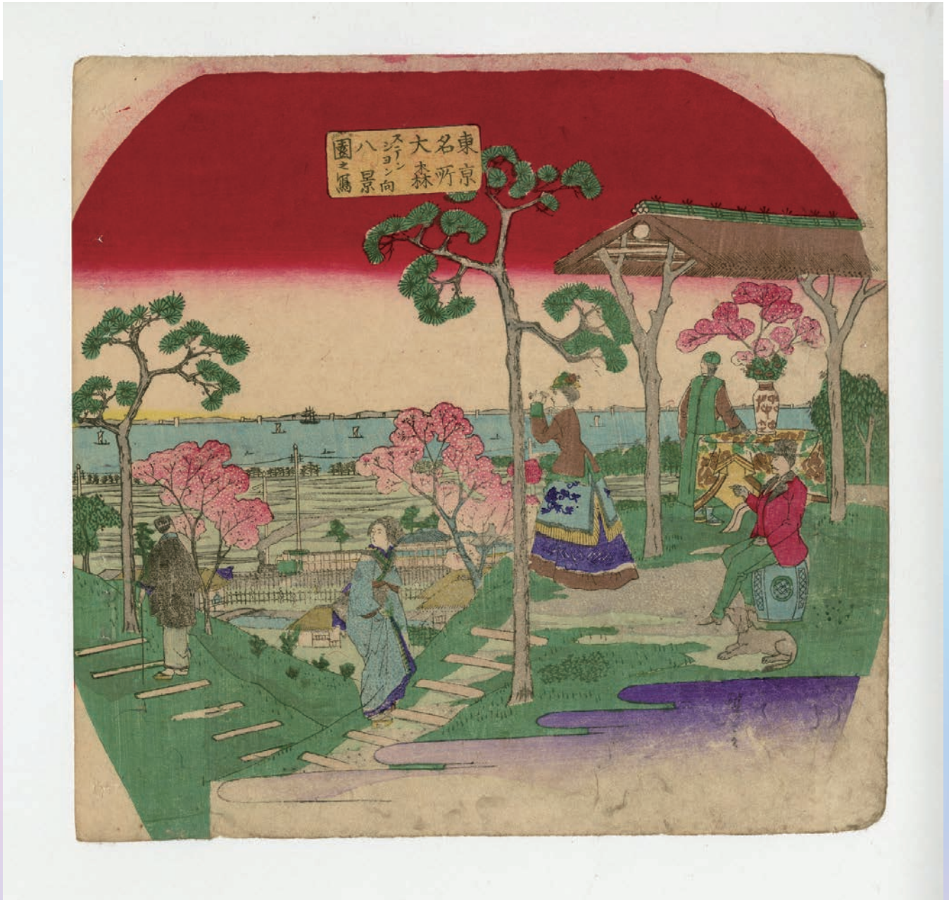
東京名所 大森ステーション向八景園之写(大田区立郷土博物館所蔵)

八景坂上からは東京湾の東端より房総まで一望のもとに見渡せたという。本作では坂下の東海道本線を旅客用蒸気機関車が走り、東京湾沿岸に東海道の松並木を描く。海上には帆船の他、蒸気船も浮かんでいるのが見える。