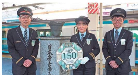
大森駅ホーム 日本考古学発祥之地の碑

そして、「大森 海苔子」とか名乗っていた面白い駅長がいた、ということを記憶に留めていただけたら嬉しいです(笑)。