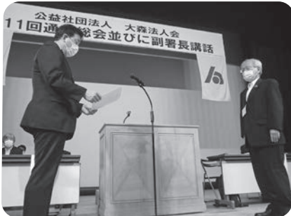
大森税務署・名取署長より「感謝のこたば」を贈呈

第11回通常総会が開催されました。今年度も、新型コロナウイルス感染拡大防止の為、アルコール消毒液の設置、マスク着用の徹底等による万全を期しての開催となりました。第一部の通常総会では、全ての議案が満場一致で承認可決されました。