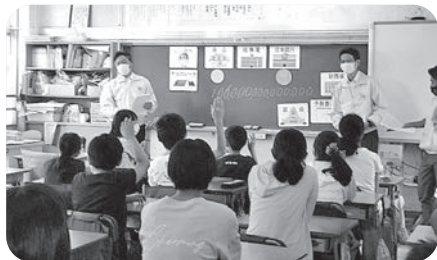
梅田小学校での授業風景