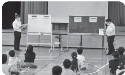
徳持小学校での授業風景

大田区租税教育推進協議会より要請を受け、大森税務署管内の小学校3校の6年生を対象に租税教室が実施されました。青年部会の役員が先生となって、税金の種類や使い道を解説しながら、税金の大切さを学んでもらいました。授業の最後には実際の1億円を模したレプリカに触れてもらい、色々な意味でお金の重みを知る機会となりました。