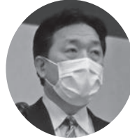
▲来賓を代表して ごあいさつ頂いた 大森税務署・名取署長