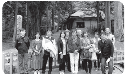
中尊寺、金色堂の前で記念写真

10月8日(金)・9日(土) 参加者11名 会場: 瑞巖寺、石ノ森萬画館、東日本大震災遺構、 伝承館、中尊寺