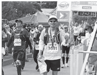
▲令和元年6月開催のサロマ湖UMにて

私は昭和63（1988）年の東京国税局採用ですが、職歴の大半となる20年余りを財務省（旧大蔵省）の主税局で勤務して参りました。主税局での仕事の前半に歳入予算の見積もり、後半に税制の企画立案を担当しました。歳入を担当し始めた時期はバブルが崩壊の真只中で、歳入欠陥を出さないよう苦労しました。歳入欠陥とは実際の歳入が当初予算の見積もりを下回