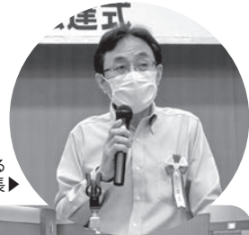
あいさつされる 金澤署長▶