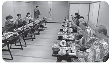
コロナに負けずがんばろう乾杯!