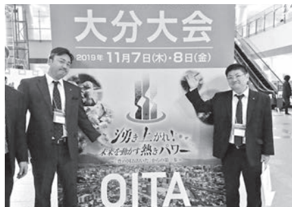
▲青年部会「大分大会」にて

私が幼いころは世の中の景気もよかったし、父はとても忙しくてほとんど家にいませんでした。厳しい反面、自由にやりたいことをやらせてくれました。私が会社を継いだのは専門学校を卒業して2年後です。その2年間はアルバイトをしてお金をためて海外に行きサーフィンをする。そんな生活をしていました。でも、大学に進学した友達が社入会に入ると同じタイミングで、自分も社会人にならないといけない、と考えて、会社に入