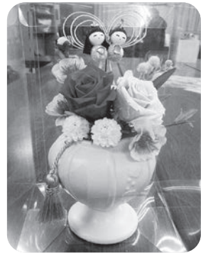
▲プリザーブドフラワー