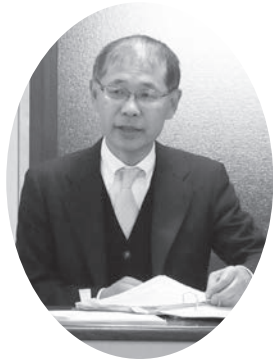
▲大森税務署 繁田上席調査官