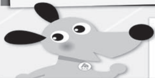
○ 点検結果記入表 (3月31日点検分)

企業を成長させるためには、売上を増やし利益を上げることはもちろんですが、内部統制面の強化や経理面の質を向上させることも重要な要素です。「入出金が適切に管理されるようになる」「内部の不正行為を未然に防止できる」など結果的に企業の成長にもつながることが期待できます。法人会では、こうした「自主点検」を簡単にできるようにするため、「自主点検チェックシート・ガイドブック」を作成いたしました。企業の皆様、自社の成長・税務リスクの軽減のために、ぜひご活用ください。