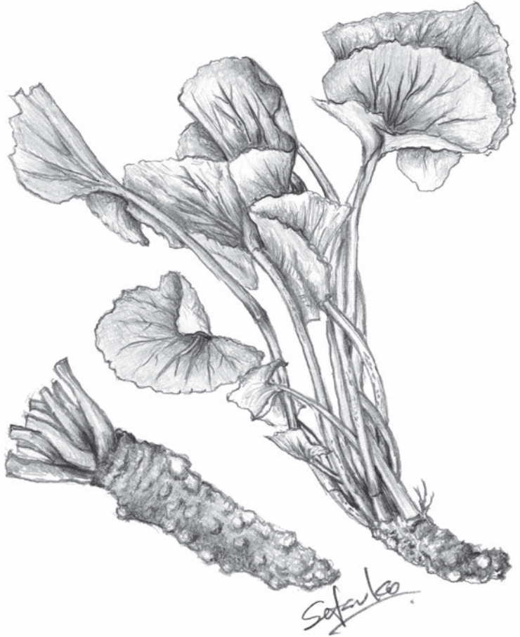
(作者・京浜容器株 内海節子氏)