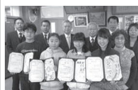
山王小学校 受賞者の皆様