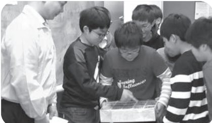
▲1億円の重さ体験コーナーで、生徒達も大興奮!