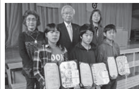
入新井第一小学校 受賞者の皆様