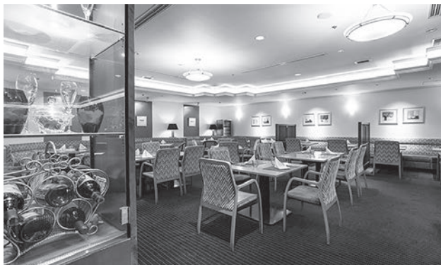
▲5F「レストラン シャングリ・ラ」

入社後は、横浜に配属され、2000年にセルリアンタワー東急ホテル開業準備室に異動となりました。大型ホテルの部門支配人として、客室関係セクションとフィットネスクラブ、エグゼクティブサロ