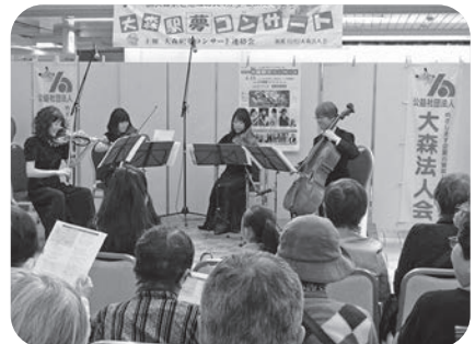
▲ユニフィルによる弦楽四重奏。 歌詞カードが配布され、懐かしの童謡・唱歌に合わせて、 みんなで合唱のひとこまも