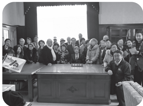
▲文部科学省「情報ひろば」にて