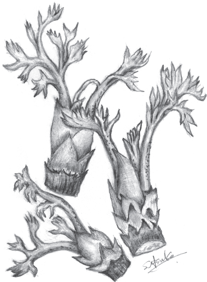
(作者・京浜容器株式会社 内海節子氏)