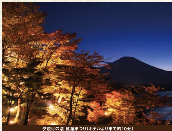
夕焼けの渚 紅葉まつり (ホテルより車で約10分)