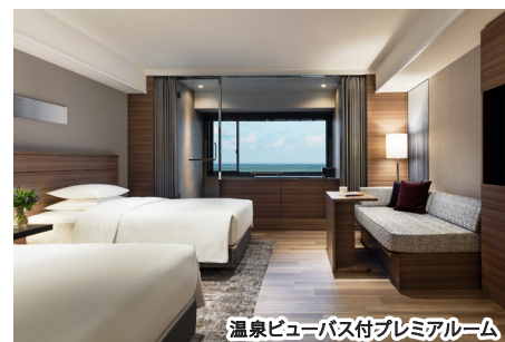
温泉ビューバス付プレミアルーム

愛らしいジャイアントパンダや、感動のマリンライブ、広大なサファリ などで人気のテーマパークで癒しのひとときを。