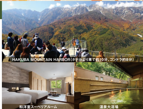
HAKUBA MOUNTAIN HARBOR (ホテルより車で約10分、ゴンドラ約8分)