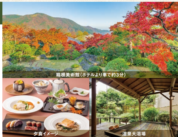
箱根美術館 (ホテルより車で約3分)

会員料金 1泊2食 19,700～26,700円 (一般料金 23,650～42,350円)