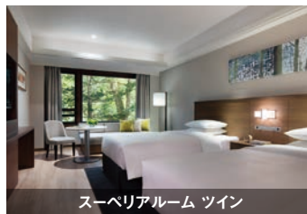
スーパーリアルーム ツイン