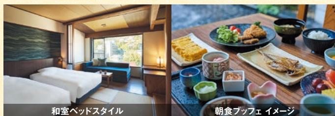
和室ベッドスタイル

会員料金 1室2名様利用時/ 1名様あたり [和室ベッドスタイル] 大人 10,900円～