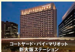
コートヤード・バイ・マリオット 新大阪ステーション

ウェスティンホテル仙台 コートヤード・バイ・マリオット 東京ステーション 東京マリオットホテル コートヤード・バイ・マリオット 新大阪ステーション