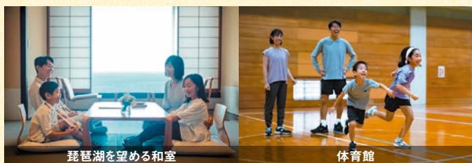
琵琶湖を望める和室

会員料金 1室4名様利用時/ 1名様あたり [和室 琵琶湖側] 大人 5,000円～