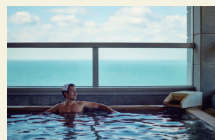
温泉大浴場 露天風呂