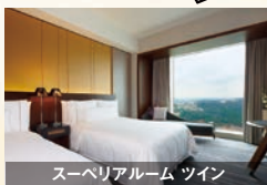
スーパーリアルーム ツイン

※お部屋タイプは禁煙/喫煙、ベッドタイプ含めてお任せで、チェックイン時のご案内となります。