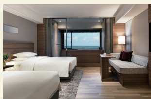
温泉ビューバス付 プレミアムルーム

プライベート温泉を存分に堪能できる温泉付客室や、最上階の温泉大浴場をはじめ、館内からは太平洋の絶景をお楽しみいただけます。