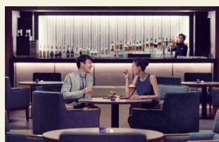
ラウンジ滞在イメージ