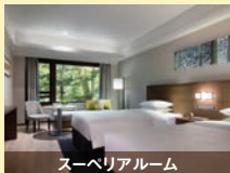
スーパリアルーム