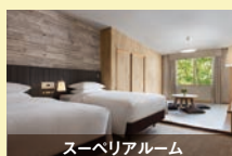
スーペリアルーム