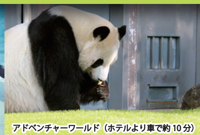
アドベンチャーワールド (ホテルより車で約10分)

コバルトブルーの海を望む「海側・和洋室」のお部屋が期間限定でお得！ お部屋代のみで、ご朝食（通常料金 4,500 円）を無料でお召し上がりいただける嬉しい特典付きのプランです。 お部屋はゆったりお寛ぎいただける和室付きなので、小さなお子様連れのファミリーにもおすすめ。 1日5室限定プランですので、ご予約はお早めに！