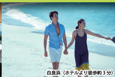
白良浜 (ホテルより徒歩約3分)