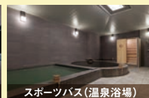
スポーツバス(温泉浴場)