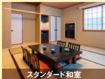
スタンダード和室