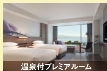
温泉付プレミアムルーム