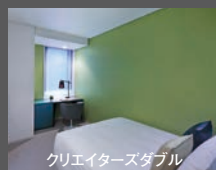
クリエイターズダブル