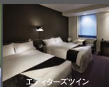
エディターズツイン