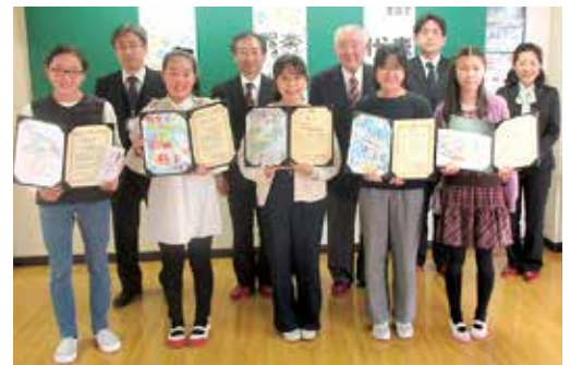
入賞者の皆さんと