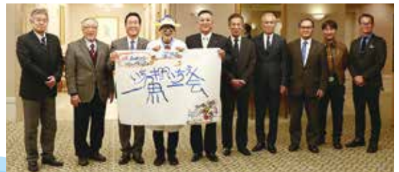
正副会長と運営スタッフ