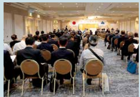
第14回社員総会の様子