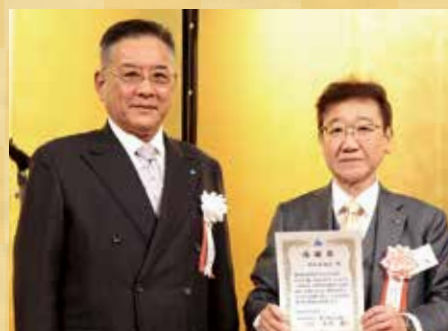
早期目標達成地区 第3支部 平和台地区 中里地区長