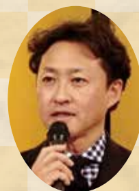
上野練馬区議会議員