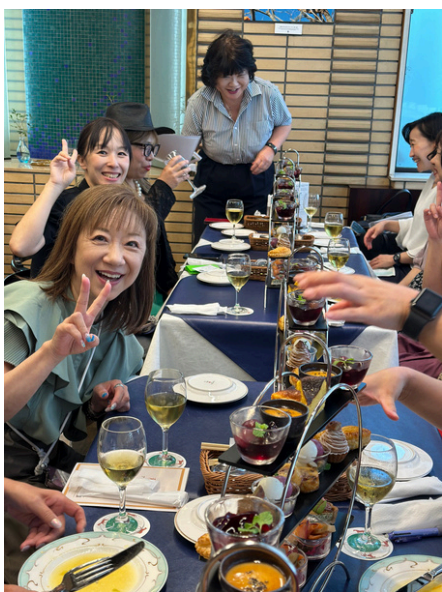
法人会の女性部会の活動の様子