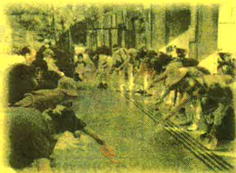
写真は昨年度の様子です。