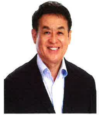
目黒区長 青木 英二

真夏の中目黒のまちがさらに熱くなる「中目黒夏まつり」の季節となりました。コロナ禍の影響で中止とせざるを得ない状況が続いておりましたが、今年は4年ぶりに開催となります。