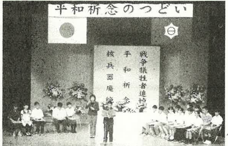
(平和の特派員による体験報告)