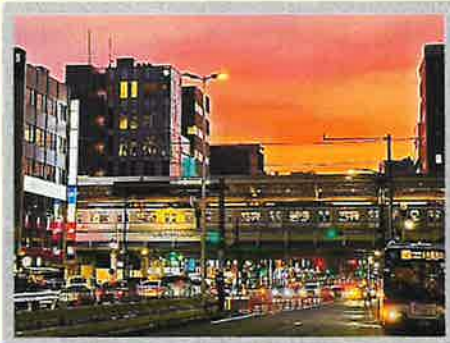
銀賞「中目黒夕景色」