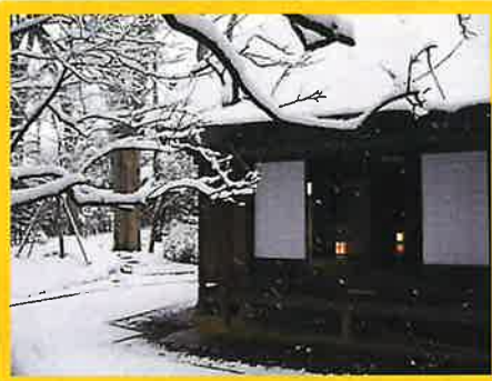
金賞「小さな公園の四季」

今年度は「私が撮ったお気に入りの目黒」をテーマに募集しました。ご応募いただいた128作品から金賞・銀賞・銅賞をご紹介します。全ての入選作品は当協会ホームページで発表予定です。