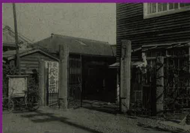
目黒町役場

昭和7年10月1日に荏原郡目黒町と荏原郡碑衾町が合併し、目黒区が誕生しました。今年が目黒区が誕生してから90年を迎える節目の年となります。目黒区区制施行90周年を記念し、本展示では、昭和7年から現在に至るまでの目黒区がたどった90年の歴史を紹介します。