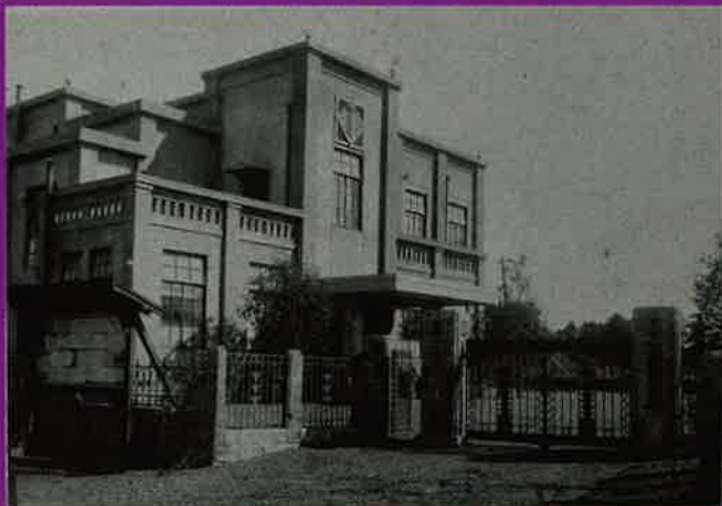
碑衾町役場