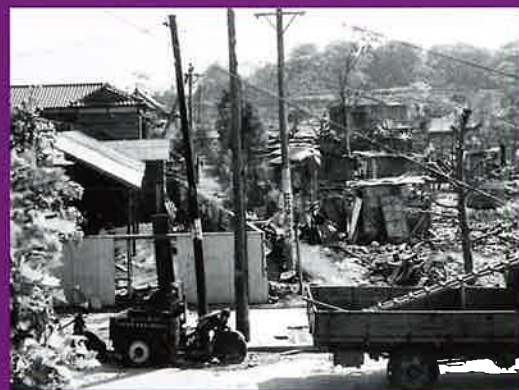
空襲の2日後 (昭和20年、当館蔵)

※コロナウィルスの感染状況により、内容の変更、または中止となる可能性があります。最新の情報はめぐろ歴史資料館HPをご確認ください。