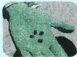
5月初めに種まきをしました

今年は、昨年に採取してきた種から栽培し、ス ポンジを作ることに挑 戦します! その様子を毎 月お伝えしていきたいと 思いますので、どうぞお 楽しみに♪