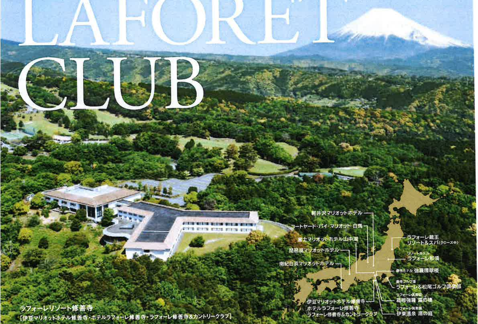
ラフォーレリゾート 修善寺 【伊豆マリオットホテル修善寺・ホテルラフォーレ修善寺・ラフォーレ修善寺&カントリークラブ】