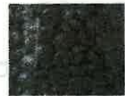
着色された ペレット