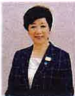
主催者メッセージ： 小池 百合子 東京都知事