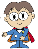
主税局イメージキャラクター タックス・タクちゃん

⚠ 申告期限（令和3年2月1日）を過ぎてしまった場合、軽減措置を受けることができなくなります。お早めにご申告いただきますようお願いいたします。