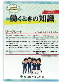
(表紙は令和元年度版)