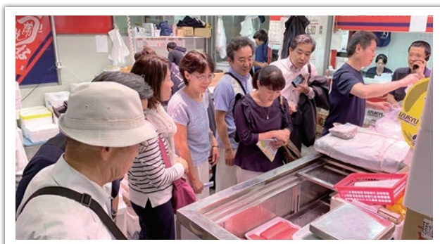
開催：9月19日 場所：豊洲市場