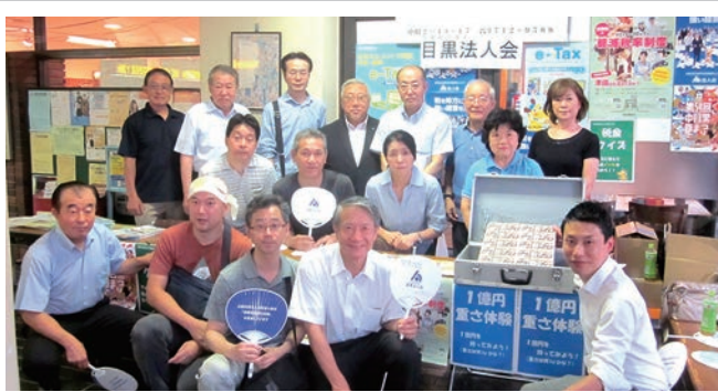
開催：7月27日～28日 場所：目黒区民センター