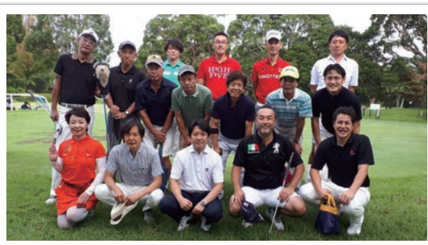
開催：9月27日 場所：真名カントリークラブ