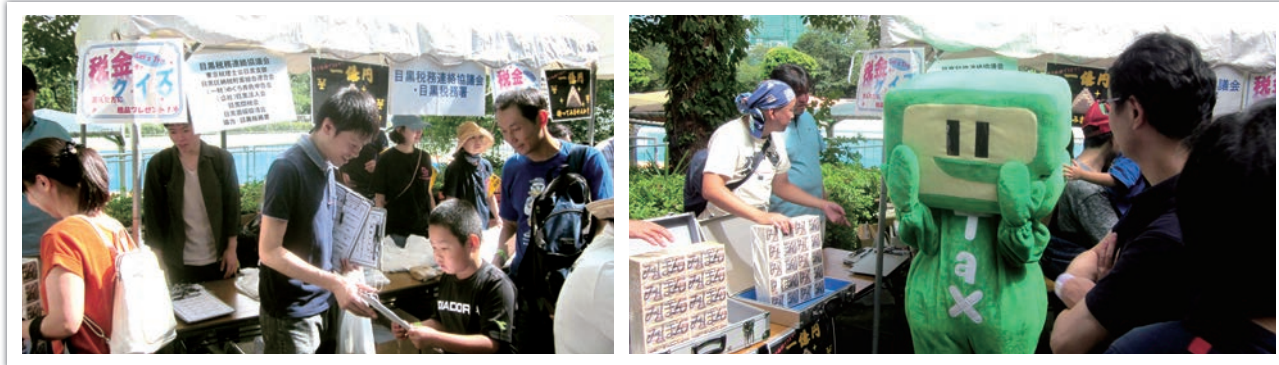
開催：9月15日 場所：目黒区民センター