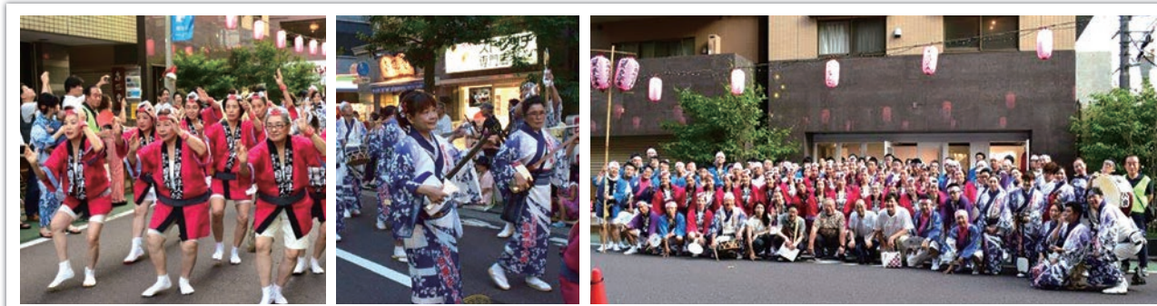
開催：8月3日 場所：目黒銀座一帯