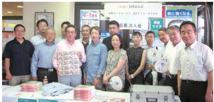
開催日：7月28日（土）～29日（日） 場 所：目黒区民センター