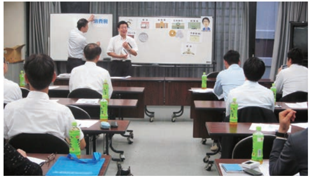
開催日：7月2日（月） 場 所：法人会館