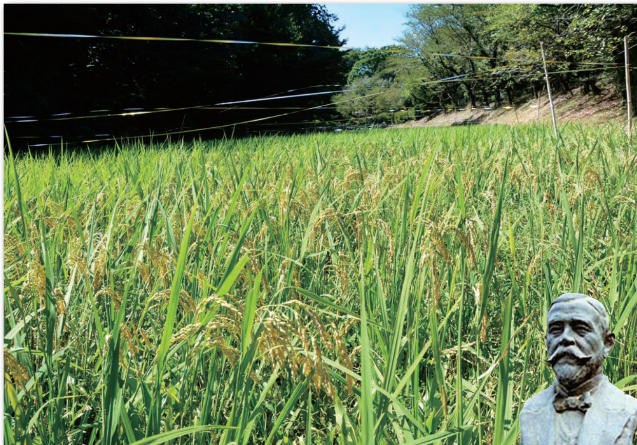
目黒の歳時記：駒場ケルネル田圃（目黒区駒場野公園内）