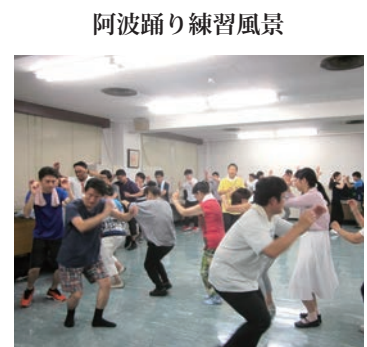
阿波踊り練習風景