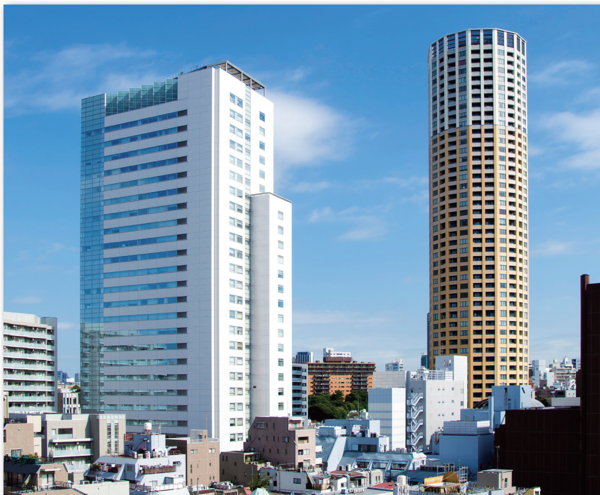
目黒の歳時記：中目黒駅前の風景