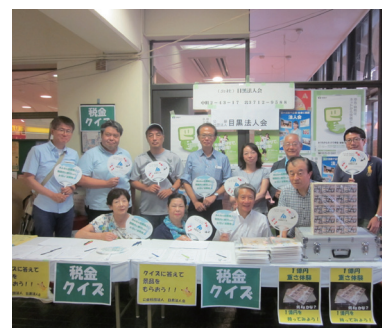
開催日：7月22日～23日 場 所：目黒区民センター