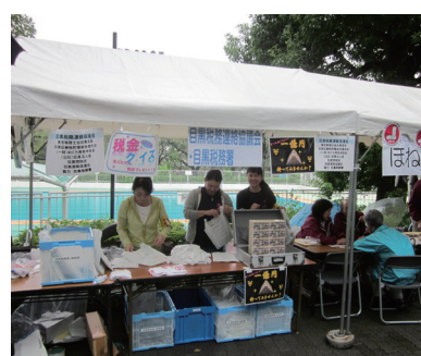
開催日：9月17日 場 所：目黒区民センター