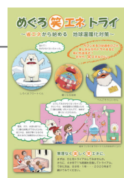
「めぐろ笑エネトライ」の表紙

環境に配慮した行動に取り組む事業所を応援するプログラムです。参加し、認定されると、目黒区から「地域と地球の環境を守りはぐくむまち」の実現に寄与していることと、実施している「環境配慮行動」を確認した旨を記した「認定証」を交付いたします。また、希望により目黒区のホームページで、環境配慮行動を実施する区内事業所として紹介します。