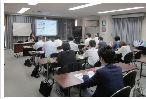
開催日：7月12日、20日 場 所：法人会館 講 師：NTT 東日本