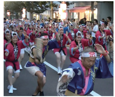
開催日：8月5日 場 所：目黒銀座周辺