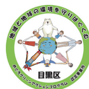
認定事業所ステッカー