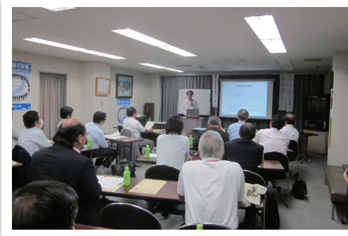
開催日：9月15日 場 所：法人会館 講 師：岡目黒税務署長