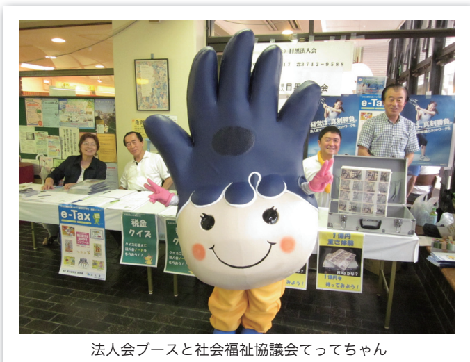
法人会ブースと社会福祉協議会てっちゃん