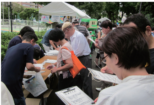
税金クイズで税のPR