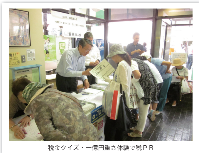
税金クイズ・一億円重さ体験で税PR