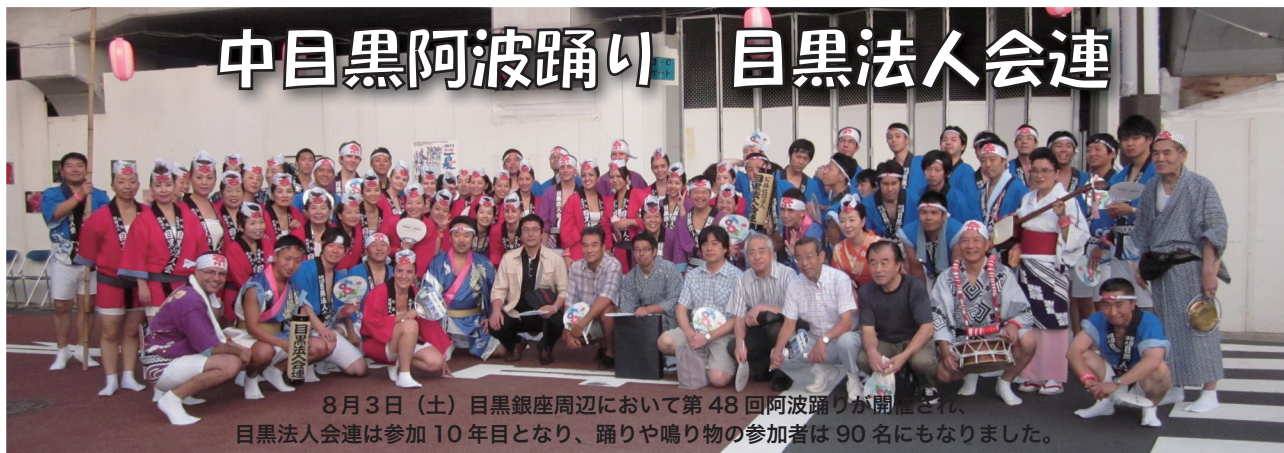
8月3日(土)目黒銀座周辺において第48回阿波踊りが開催され、目黒法人会連は参加10年目となり、踊りや鳴り物の参加者は90名にもなりました。