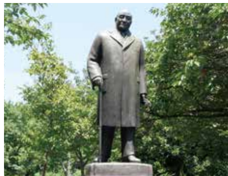
皇居外苑・北の丸公園 園内