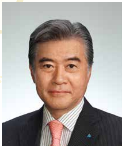
公益社団法人 麴町法人会 会長