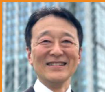
東京都千代田都税事務所長

電子申請・申告 (e-Tax)、特に法人税の ALL e-Tax の推進とともに、キャッシュレス納付や納税証明書のオンライン請求の利用拡大等について、法人会の皆様とも「協働」して全力で取り組みます。本年もよろしくお願い申し上げます。