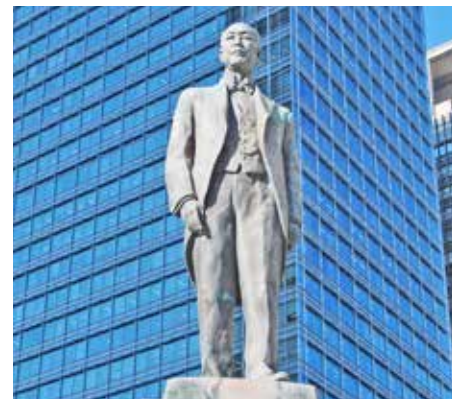
東京駅 丸の内駅前広場

現在の像は立て直しされたもので、初代の像は高知の坂本龍馬像で有名な山本白雲によって制作。その後戦時中に撤去されると、「東洋のロダン」と呼ばれる彫刻家・朝倉文夫（常磐橋公園の渋沢栄一像も制作）により再建されました。