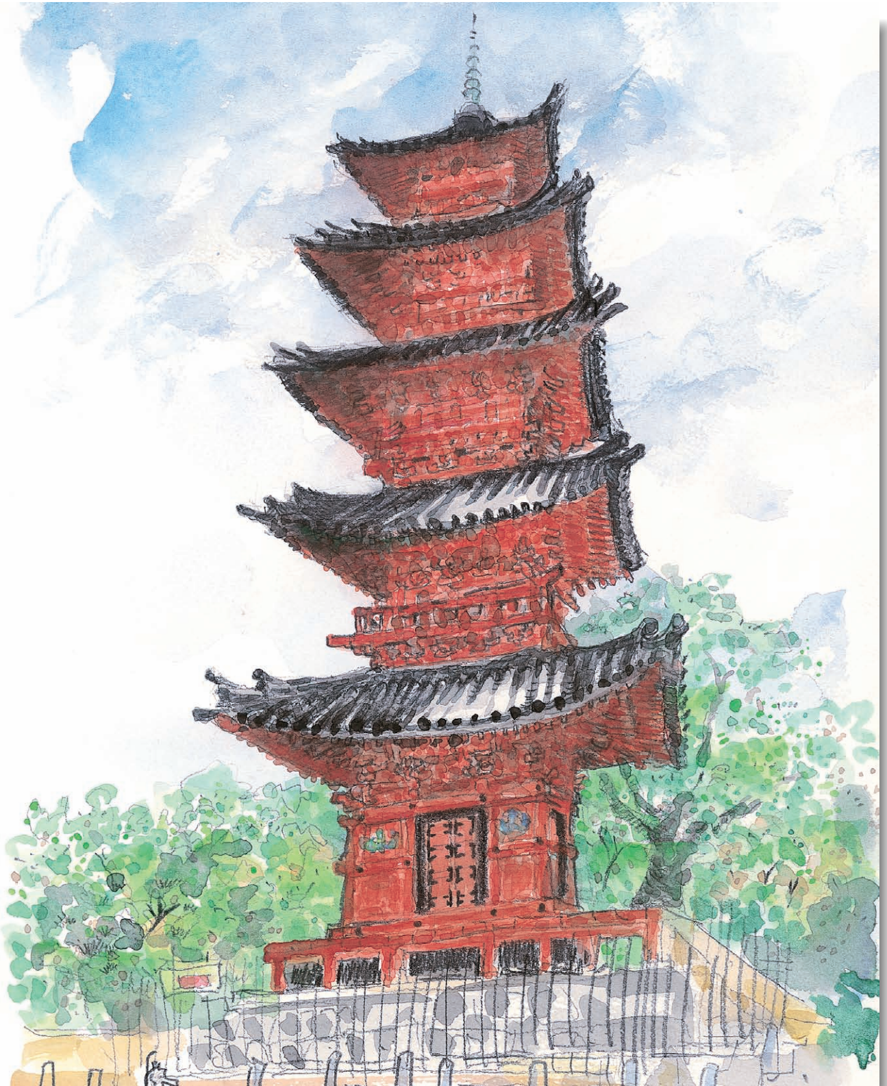
本門寺五重塔／スケッチ 山下雄平