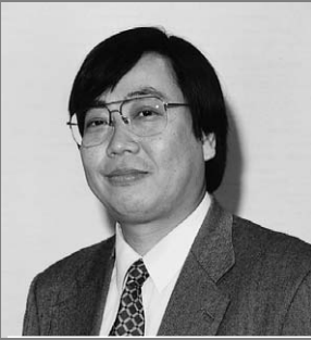
経営ジャーナリスト

会社の経営状態がいいのか悪いのか。感覚だけでとらえていたのでは、経営の舵取りを誤ってしまう。現実の数字を見て、決断するのが優良な経営といえる。