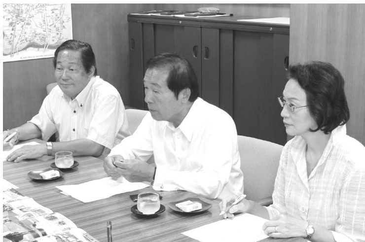
左から藤本広報副委員長、古田広報委員長、山本事務局長