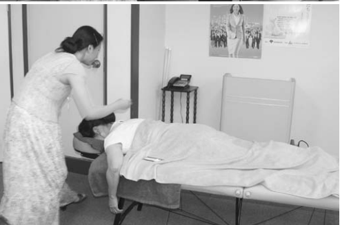
自分で刺激できるポを教えてくださいます(上)鍼初心者の方への鍼打ちです(下)

続いて、肩こりのひどい方にベッドに俯せになってもらい、首筋から肩にかけて集中的に鍼を刺していきました。鍼灸初めてのこの方は、起き上がる頃には気持ち良さそうな表情が印象的でした。