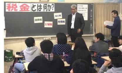
管内の小学6年生を対象に、租税教室を実施