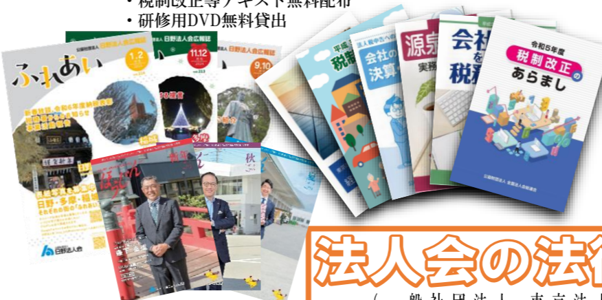
広報誌「ふれあい」 企業PRコーナー無料です。