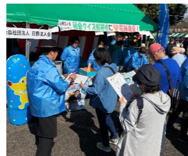
「税を考える週間」税のPR 税金クイズ：税のなんでも相談 相談員：東京税理士会日野支部