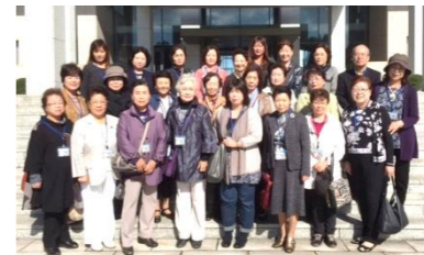
女性部会 日帰りバス研修