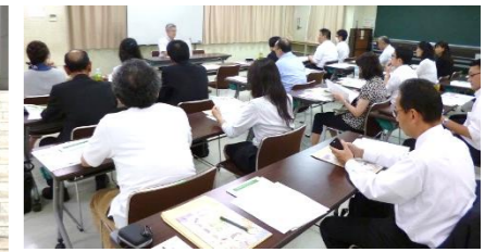
源泉部会 テーマ別研修会