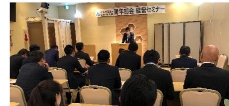
青年部会 経営セミナー