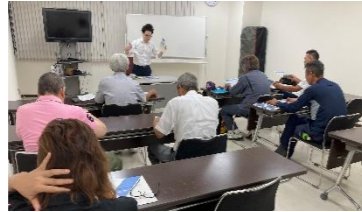
支店税務研修会 最新の税制に関する情報などをテーマに行われます。

支部税務研修会、法人税・消費税講座、改正税法説明会、決算法人説明会、新設法人説明会、初級簿記セミナー、年末調整説明会等