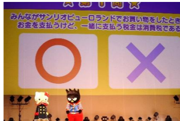
管内の小学生を対象に、税金の大切さを理解してもらうイベント「ハローキティと税について知ろう！」