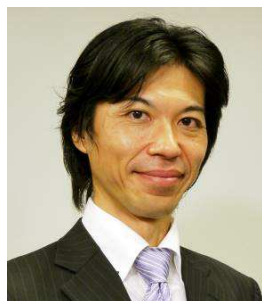
財務リスク研究所株式会社 代表取締役