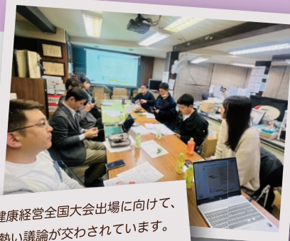
健康経営全国大会出場に向けて、 熱い議論が交わされています。

身近な健康から、働く環境をもっとよくしませんか？ 健康経営を楽しく学び、実践するヒントをお届けします。