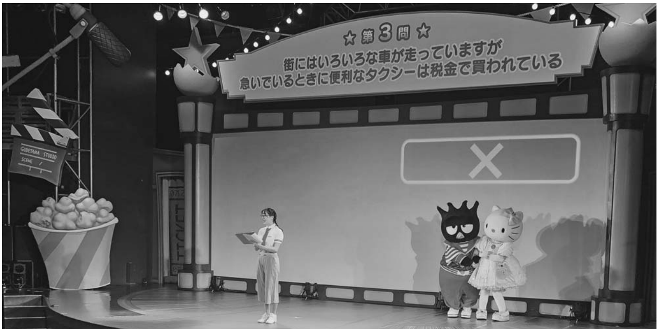
サンリオの人気キャラクターが登場、税に関するクイズ4問を出題

夏休み恒例の租税教育イベントが、昨年に引き続きサンリオピューロランドを会場に8月5日（土）に「ハローキティと税を知ろう」をテーマに開催。事前申込336件594名の中から、厳正な抽選の結果、当選された小学生・幼児・保護者等合わせて260名が参加しました。