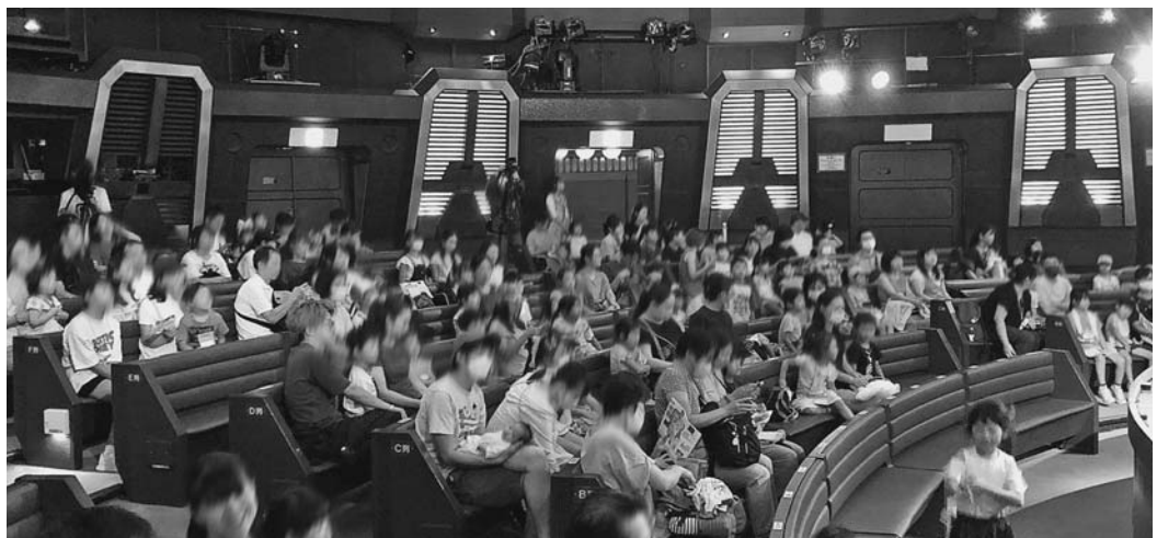
子供達も保護者と一緒に〇×クイズやゲームで楽しみました