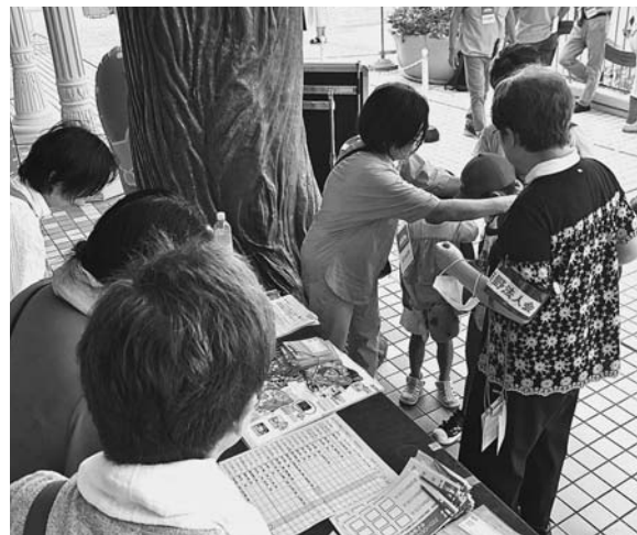
受付は家族ごとに密にならない様に心がけて対応

このイベントには、共催の日野税務署から斉藤彰署長、倉橋明弘副署長はじめ幹部の方々にご協力をいただきました。来賓として阿部裕行多摩市長、高橋勝浩稲城市長、波戸尚子日野市副市長にご臨席をいただきました。