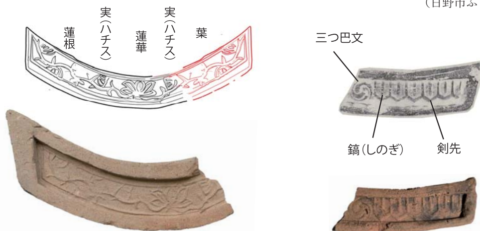
京王百草園出土(真慈悲寺)「蓮華唐草文軒平瓦」