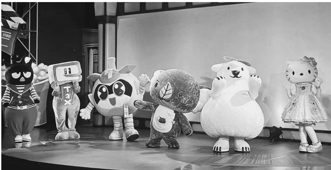
ディスカバリーシアターのステージ上で会場内を盛り上げてくれました。

夏休みのよき思い出として、有意義な一日を楽しみました。開催までには感染拡大に注視しながらのイベントでしたが、事故やケガもなく無事終了しました。