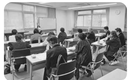
稲城地区 11月15日 稲城市商工会