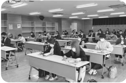
日野地区 11月8日 日野市ふれあいホール