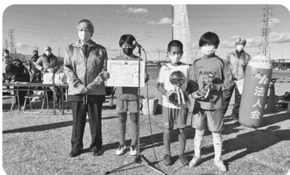
賞状とトロフィーを受け取った優勝チーム代表