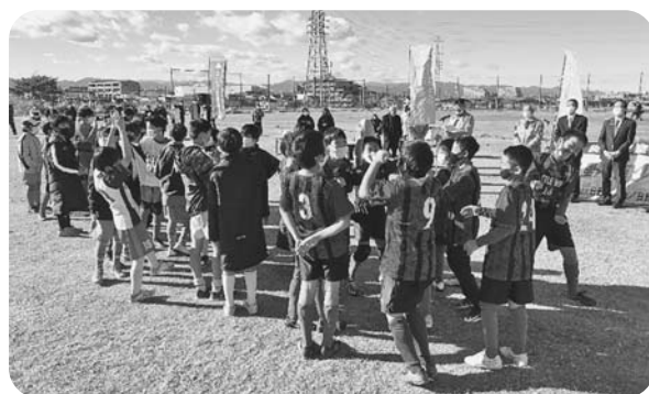
子供たちにも身近な消費税をクイズに