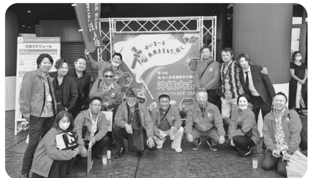
岩田会長、石坂副会長、朝倉青年部会長ほか多数が参加