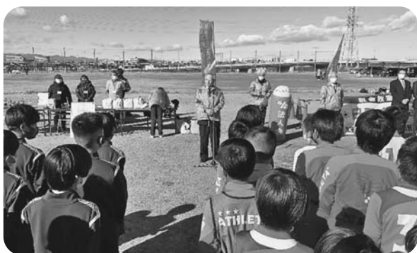
岩田会長より、今日は税金について学んでくださいと挨拶

この大会は同連盟少年部所属の全チームによる予選リーグ、決勝トーナメント方式で争いました。表彰式では岩田会長より上位4チームに賞状とトロフィーを、MVP最優秀選手賞1名と優秀選手賞2名にトロフィーを贈りました。