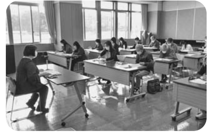
稲城地区 11月10日 稲城市地域振興プラザ