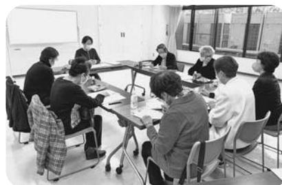
多摩地区 11月25日 多摩市健康センターつむぎ館