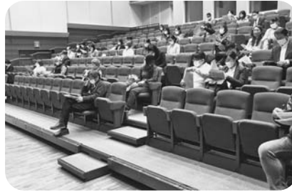
多摩地区 11月11日 多摩市関戸公民館ヴィータホール