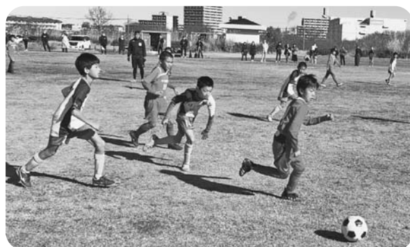
19チームで争った最終の決勝戦