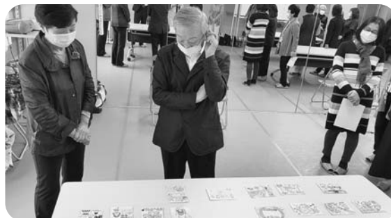
絵はがきコンクール選考会