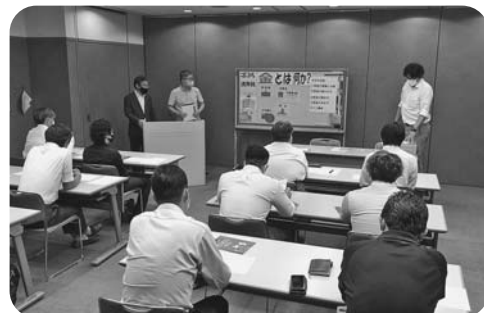
授業の相手は小学6年生の児童と思って説明する講師