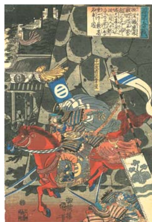
▲平山季重が描かれている 錦絵 「源平合戦図」歌川国芳筆

平氏滅亡後には、頼朝の許可を得ずに勝手に任官したため不興をかうこともありましたが、その後、奥州征討（奥州藤原氏との戦い）に従軍したほか、頼朝上洛の随行や三代将軍になる源実朝が生まれた際には「鳴弦役（弓の弦を鳴らして悪霊などを退散させる儀式）」をつとめるなど、頼朝に重用されていました。