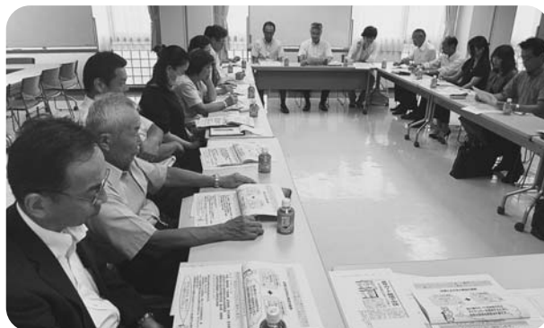
8月27日 源泉部会 京王クラブ