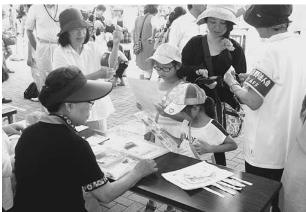
受付を済ませて「税金クイズチェックシート」を渡す