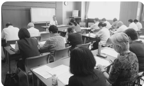
9月2日 稲城地区 稲城市地域振興プラザ