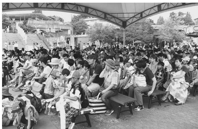
小学生、幼児とその保護者合わせて800名が参加