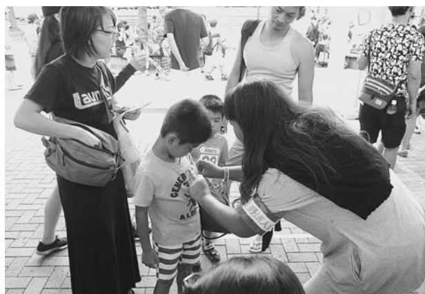
女性部会員より、胸に入場ワッペンをつけてもらう