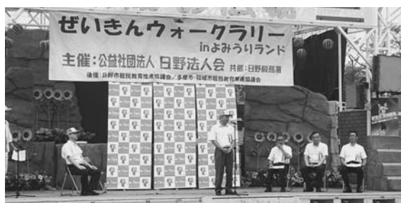
岩田会長より、「今日はぜいきんについて 楽しく学んでください」と挨拶

小学生を対象とした租税教育イベント「第8回ぜいきんウォークラリーinよみうりランド」が、8月8日（土）に開催され、小学生、幼児や保護者合わせて800名が参加しました。