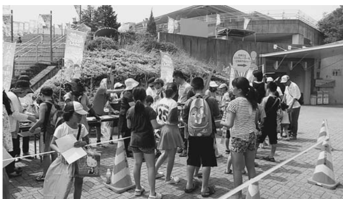
ゴールポイントでフリーパス券とお土産をもらう子供たち