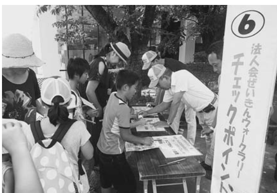
ぜいきんクイズの正解者に合格印を押す