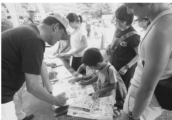
お父さんやお母さんと相談しながら解答する子供たち