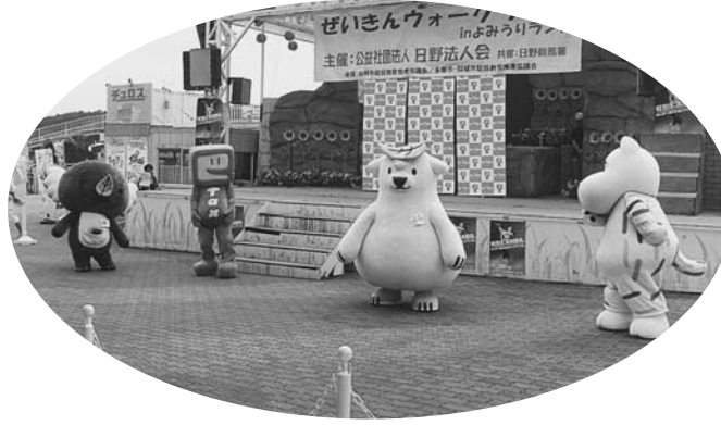
イベント応援に駆け付けたキャラクターたち