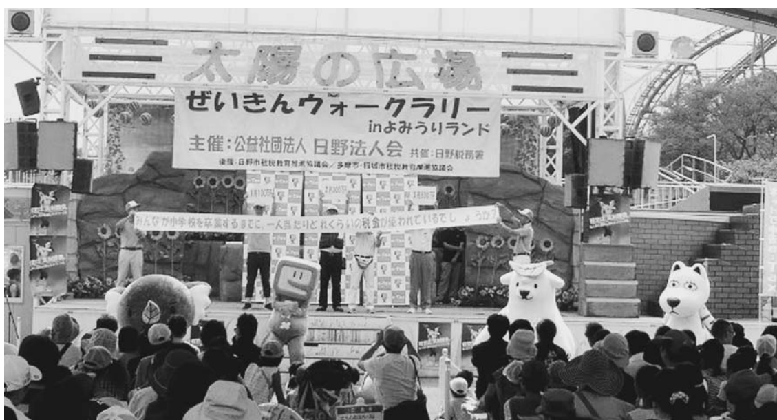
ステージ上で行われた「ぜいきん教室」