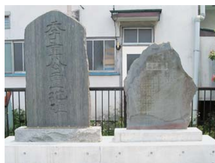
▲「平山季重遺跡之碑」と「季重公霊地碑」の石碑

京王線平山城址公園駅前には、「平山季重遺跡之碑」と「季重公霊地碑」の石碑が並んでいます。「平山季重遺跡之碑」は、嘉永4年（1851年）に平山正義によって建立されたもので、撰文と書は幕末の剣術家としても有名な男谷信友によるものです。「季重公霊地碑」は、大正14年に七生青年団平山支部によって建てられたものです。