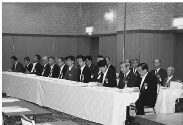
板橋日野税務署長をはじめ多数のご来賓の方々