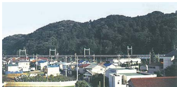
鎌倉時代の山城、小沢城跡