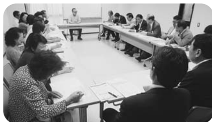
5月20日 多摩地区第1～9支部