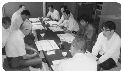
5月19日 日野地区第7・8支部

支部報告会を兼ねた税務研修会がそれぞれ開催されました。支部報告会では、平成26年度の活動報告が行われ、引き続き税務研修会では、平成27年度税制改正やマイナンバー制度の概要を中心に日野税務署の中山審理担当上席がやさしく解説しました。