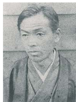
上：稲城村初代村長 森清之助