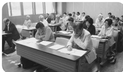
5月21日 稲城地区第1～4支部