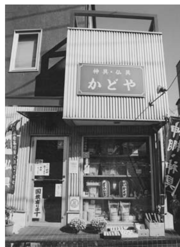
〈日野地区 第10支部所属〉