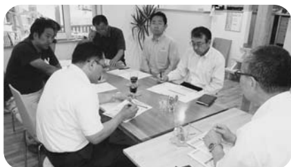
5月28日 日野地区第9支部