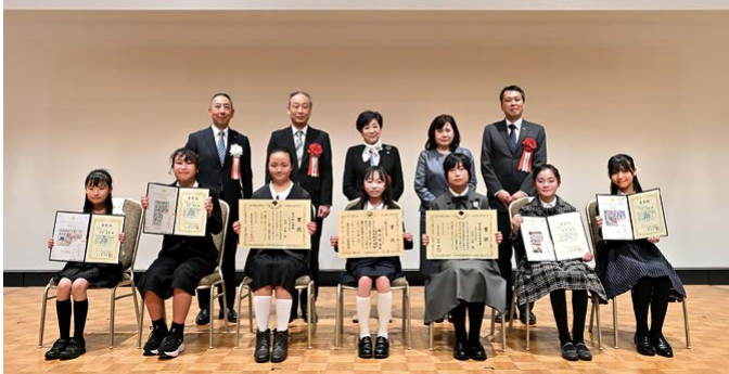
受賞者全員で記念撮影