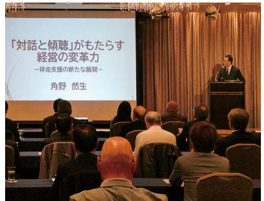
熱心に解説を聴く受講者