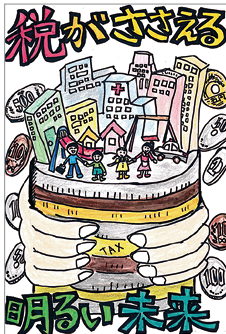
【王子法人会】 峯岸 愛さん(5年生)