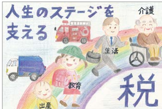
【荒川法人会】 村中 杏実さん(6年生)