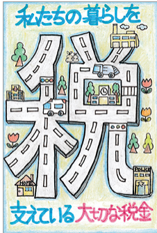
【練馬東法人会】 宮代 桃花さん(6年生)