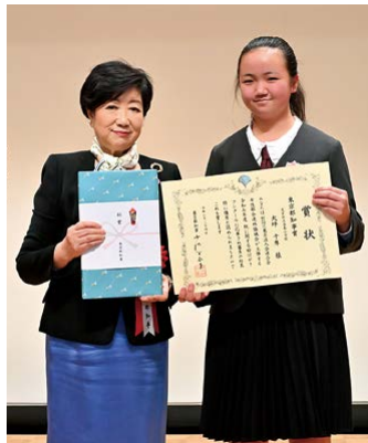
小池百合子東京都知事と都知事賞の大坪千隼さん(右)

の作品も税への理解を深め、真摯に表現に向き合った多様性に富む内容」と評価した。表彰式には小池百合子東京都知事も駆けつけ挨拶。各受賞者に表彰状と副賞が授与され、記念撮影を行った。会場入口には各会から推薦された作品全48点が掲示され、参加者の関心を集めた。