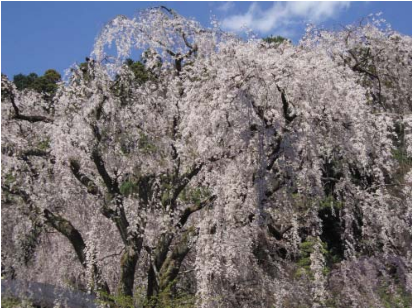
(身延山 枝垂れ桜 町田和子氏)