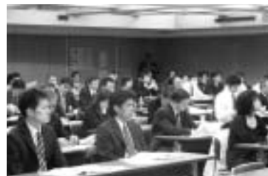
印紙税セミナー会場